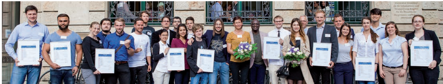
Die Preisträgerinnen und Preisträger des HHU Ideenwettbewerbs 2016

Teilnehmen können alle Studierenden, Absolventinnen und Absolventen, Wissenschaftlerinnen und Wissenschaftler sowie Mitarbeiterinnen und Mitarbeiter der HHU, der An-Institute und des Universitätsklinikums Düsseldorf.