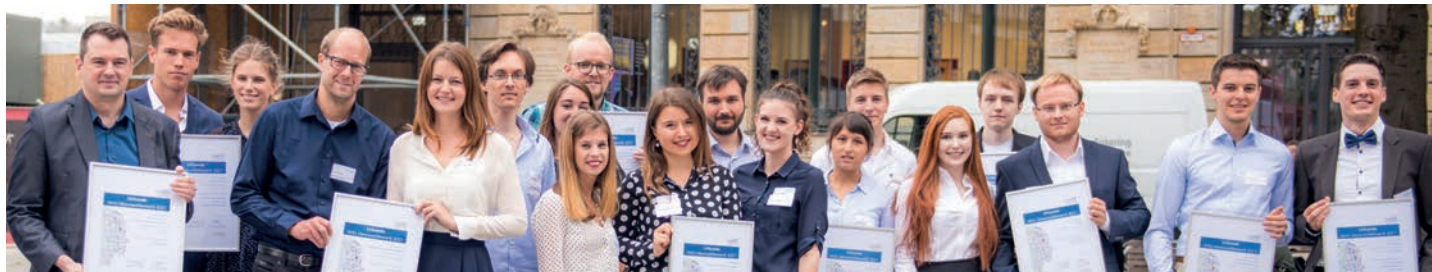
Die Preisträgerinnen und Preisträger des HHU Ideenwettbewerbs 2017

Teilnehmen können alle Studierenden, Absolventinnen und Absolventen, Wissenschaftlerinnen und Wissenschaftler sowie Mitarbeiterinnen und Mitarbeiter der HHU, der An-Institute und des Universitätsklinikums Düsseldorf.